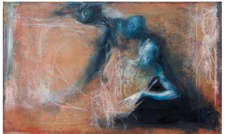
Iskanje, 2011, olje na papirju / kaširano na platno, 95,5 x 158,5 cm

Kocbek kljub prepoznavni figurativnosti ohranja pojmovanje likovnega polja kot osebnega psihičnega seizmograma: slikanje je zanj poseben obred, ki združuje mentalno-miselne priprave ter z gesto telesa in s potezami rok novo vizualno opredmetenje lastnih individualnih fizičnih in metafizičnih izkušenj. V tehnološkem in formalno oblikotvornem smislu ostaja tradicionalen, v izbrani intimni figurativni ikonografiji ter