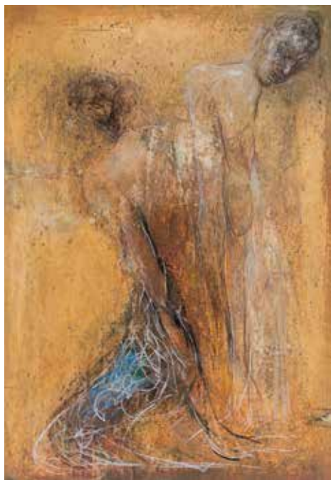
Brez naslova, 2008, oglje, pasteli, olje na papirju, 100 x 70 cm

Kocbek je hote tradicionalen v ohranjanju izbrane slikarske metodologije: ta mu daje možnost številnih variacij in maksimalne likovne izraznosti s prepoznavnim in, kljub vizualnemu figurativnemu obličju, posebnim spiritusom agensom. Le-ta diskretno napolnjuje celotno tkivo podobe: od prefinjenega in premišljeno vodenega črtnega omrežja preko le z barvnimi odtenjanji določenega prostora do voluminozno